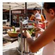
LE TEMPS DES VENDANGES 9