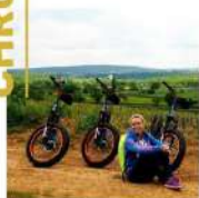
LES RENDEZ-VOUS BOURGUI TROTT' 7