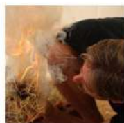
FÊTE DE LA PRÉHISTOIRE 12