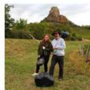
SEMAINE EUROPÉENNE DE RÉDUCTION DES DÉCHETS 16