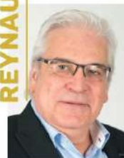
Conseiller départemental délégué au patrimoine et à la culture

Si 2019 marquait le début d'une ère nouvelle pour l'un des deux Grands Sites de France du département de Saône-et-Loire, en l'occurrence celui de Solutré Pouilly Vergisson, 2020 vient conforter ce renouvellement.