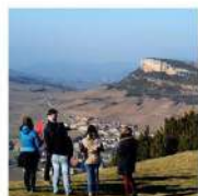
BALADE DESSINÉE 16