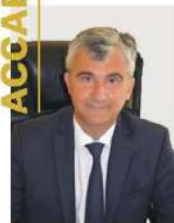
Président du Département de Saône-et-Loire