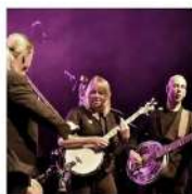
FÊTE DE LA MUSIQUE 30