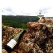
DEGUSTATION AU SOMMET 8