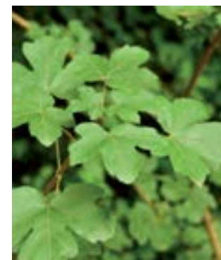
Érable de Montpellier -VT-