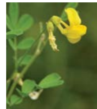
Faux Séné -VT-