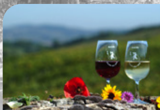
Frontière discrète entre les terroirs viticoles du Mâconnais et ceux du Beaujolais, les préférences oscillent entre rouge et blanc.

Rendez-vous au Bois de Fée pour une promenade où vous retrouverez un point de vue magnifique sur les monts du Beaujolais. Profitez de la fraîcheur des sous-bois avant de goûter au plein soleil des pelouses calcaires qui coiffent le point culminant de votre randonnée.