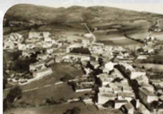
Le bois de Fée s'appelait autrefois le bois du Fay, en référence aux fayards, ancien nom des travailleurs forestiers.