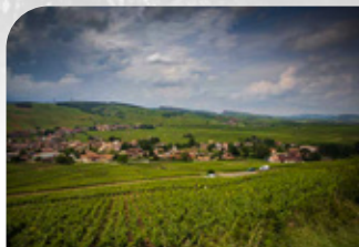
Une AOP de prestige reconnue 1er cru à l'automne 2020. Ce cépage Chardonnay s'étend sur 5 terroirs : Solutré, Pouilly, Vergisson, Fuissé et Chaintré.