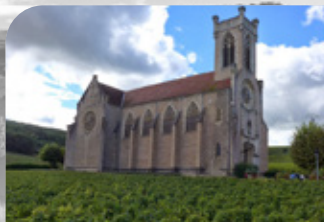
Le village de Fuissé compte deux églises : une bâtisse du 12 e siècle transformée en caveau et une, plus grande, érigée au 19 e siècle. Cette église porte par ses décors les traces de l'invasion de phylloxéra.

Parcourez le paysage de l'appellation Pouilly-Fuissé avec de magnifiques points de vue sur ce vignoble réputé. Déjà présent à la cour de Louis XIV, le Pouilly-Fuissé s'exporte aujourd'hui à travers le monde. De nombreuses caves se trouvent sur votre chemin. Faites votre choix !