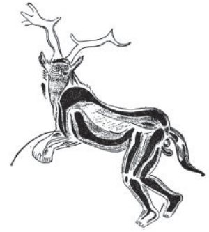
Dessin Henri Breuil

↳ Il existe aussi des représentations hybrides homme-animal comme les « sorciers » de la grotte des Trois-Frères.