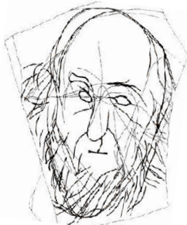
Relevé Léon Pales

↳ La grotte de La Marche, située dans la Vienne, a livré plus de 3000 plaquettes gravées dont la plupart représentent des êtres humains (dont des enfants et des bébés venant de naître) très réalistes et parfois à la limite de la caricature.