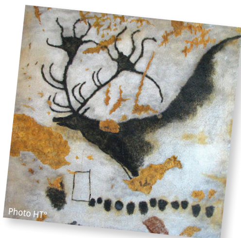
CERF ET SIGNES, GROTTE DE LASCAUX (DORDOGNE)