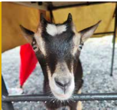
La ferme des P'tis Bilounes Lieu-dit de Premecin | 69840 Cenves

L'abus d'alcool est dangereux pour la santé, à consommer avec modération