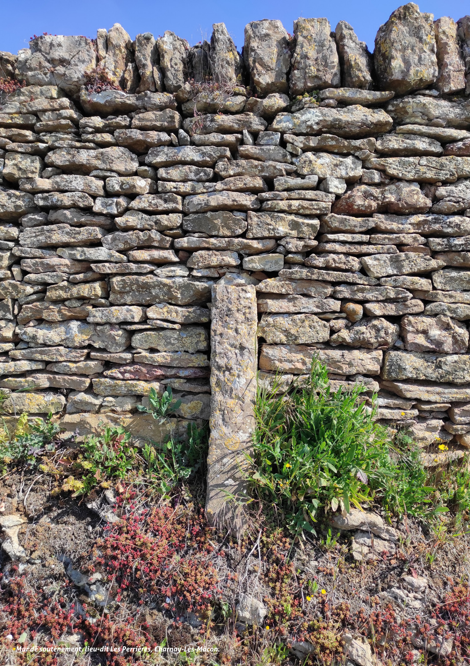
Mur de soutènement, lieu-dit Les Perrières, Charnay-Lès-Mâcon.