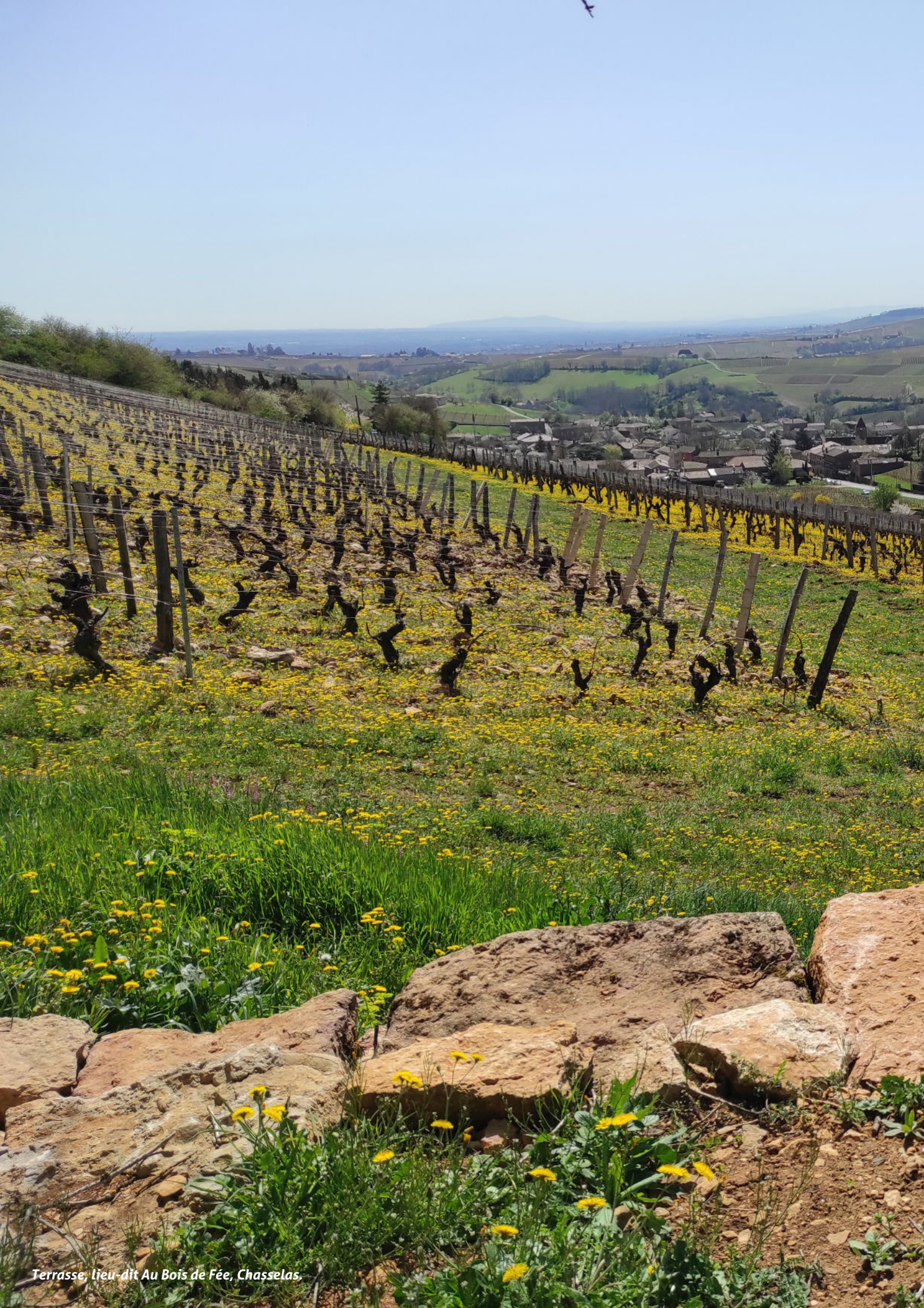
Terrasse, lieu-dit Au Bois de Fée, Chasselas.