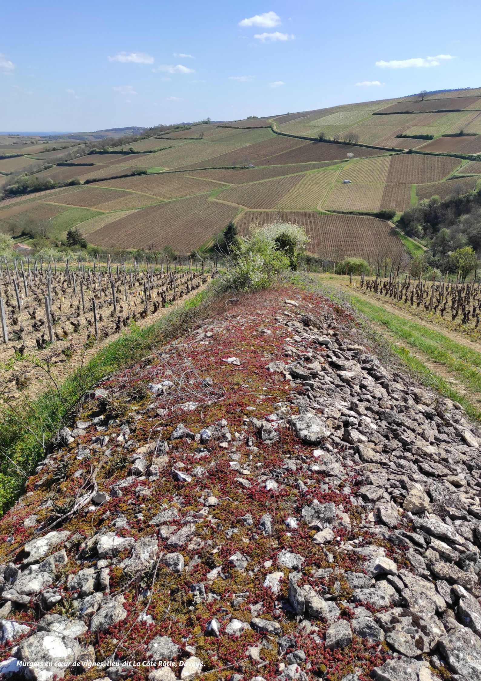
Murgers en cœur de vignes, lieu-dit La Côte Rôtie, Davayé.