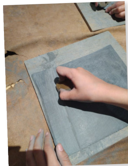
DÉCOUPER DE L'ARDOISE