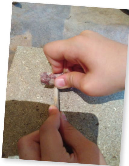
RAGLER UN MORCEAU DE BOIS