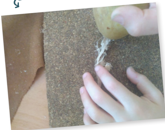
EGRASER DU TENDON